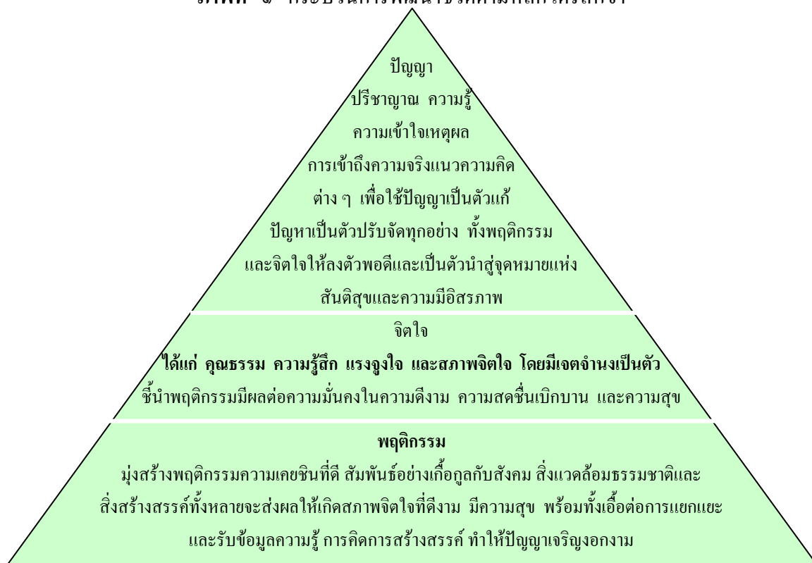
ภาพที่ ๑ กระบวนการพัฒนาชีวิตตามหลักไตรสิกขา

: สรุปแนวคิดจากหนังสือการพัฒนาที่ยั่งยืน โดยพระธรรมปิฎก (ป.อ.ปยุตโต)