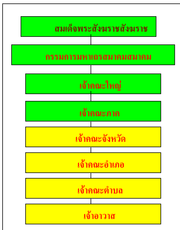
แผนภูมิที่ 2.1 แผนผังแสดงการปกครองคณะสงฆ์ในปัจจุบัน 1

1) ด้านการบริหารจัดการจากผู้บังคับบัญชา ด้านการบริหารจัดการมีความเชื่อมโยงและการบังคับบัญชาตามลำดับชั้น เชื่อมโยงถึงกัน ตั้งแต่ระดับนโยบายถึงวิธีปฏิบัติในแต่ละพื้นที่ แต่ทั้งนี้ขึ้นอยู่กับคุณภาพของผู้บริหารระดับ เจ้าคณะตำบล เจ้าคณะอำเภอ ที่จะมีความรู้ความสามารถในการบริหารจัดการให้เกิดประสิทธิภาพได้เพียงใด บางพื้นที่ผู้บริหารระดับเจ้าคณะตำบล เจ้าคณะอำเภออ่อนแอในการบริหารขาดการเอาใจใส่ดูแลกิจการคณะสงฆ์ภายในพื้นที่ของตนเองทำให้เกิดสภาพปัญหาการขาดแคลน หรือเพิ่มปัญหาการขาดแคลนให้รุนแรงยิ่งขึ้น เช่น พบว่าในบางตำบลขาดเจ้าคณะตำบลมาบริหาร การบริหารขาดความเที่ยงธรรมในการใช้อำนาจ เคยมีการร้องเรียนจากพระในเขตปกครองแต่ไม่ได้รับความเป็นธรรม ในทางตรงกันข้ามถ้าผู้บริหารคณะสงฆ์เข้มแข็งมีความรู้ความสามารถในการบริหารจัดการ ก็จะสามารถบรรเทาสภาพปัญหาหรือแก้ไขสภาพปัญหาได้