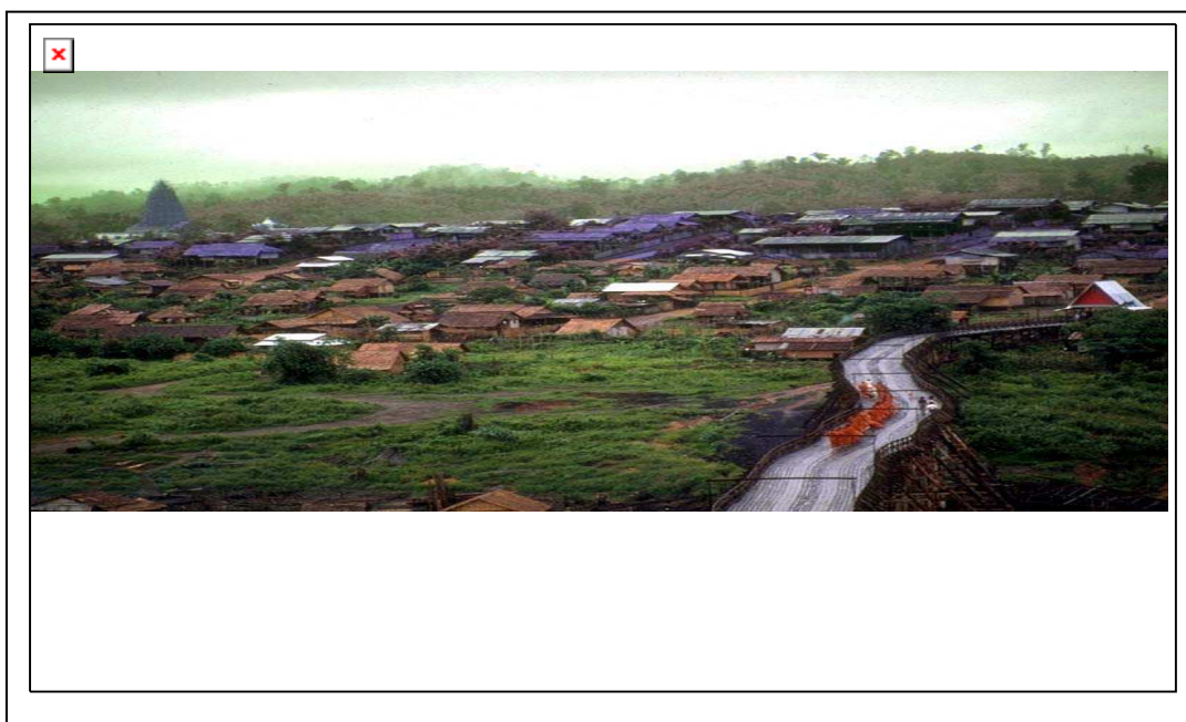
ภาพที่ 2.1 ภาพจำลองแสดงสภาพทั่วไปของชุมชน

คนในชุมชนส่วนใหญ่มีวัฒนธรรม ประเพณี วิถีชีวิตที่เป็นเอกลักษณ์ของตนเองและหลากหลายเพราะเป็นพื้นที่ที่ประกอบด้วยคน 4 เผ่า ได้แก่ ลาว เขมร กวย และไทย-โคราช มีวิถีชีวิตที่เรียบง่าย ส่วนใหญ่ประกอบอาชีพเกษตรกรรม มีเทคโนโลยีสิ่งอำนวยความสะดวกต่าง ๆ เข้าถึง สภาพการคมนาคมสะดวก มีหน่วยงานของรัฐเข้ามาให้บริการแก่ชุมชน สภาพทั่วไปของชุมชนในเขตพื้นที่เก็บรวบรวมข้อมูล สามารถแบ่งศึกษาได้ 6 ด้านได้แก่ 1) ด้านลักษณะชุมชน