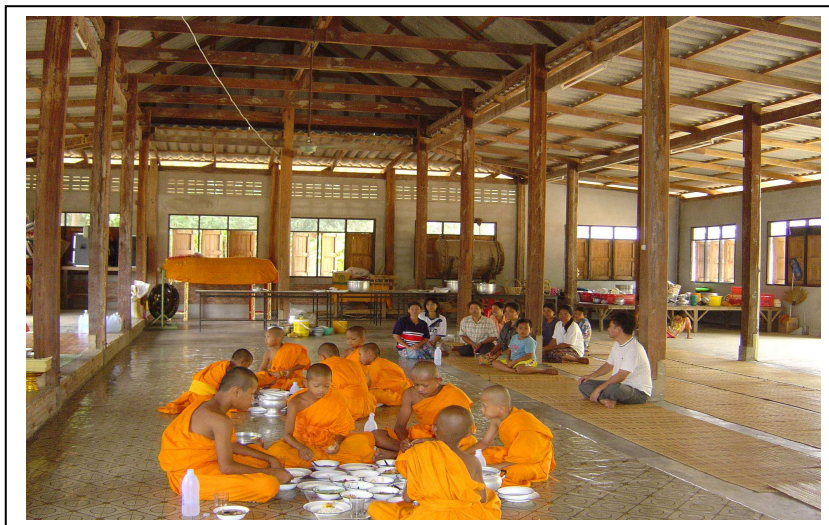
ภาพที่ 2.2 แสดงชีวิตความเป็นอยู่ของพระสงฆ์และสามเณรวัดบ้าน

2.4.2.1 ด้านลักษณะของวัด ลักษณะของวัดในพื้นที่ที่เก็บรวบรวมข้อมูลกำหนดได้ 3 ลักษณะ ได้แก่ 1) วัดในชุมชน 2) วัดนอกชุมชน 3) วัดตามภูเขา